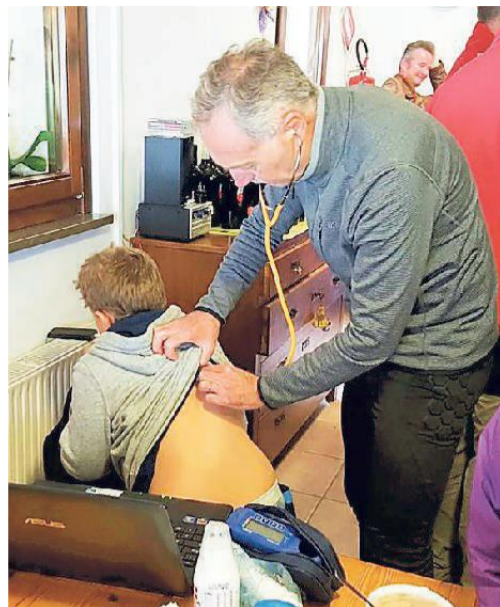
I controlli preliminari su un bambino asmatico e i percorsi nella foresta delle Valli del Natisone

sti ad un controllo medico, visita rinoscopica, spirometria, dosaggio dell'ossido nitrico esalato, prima e al termine del soggiorno, per valutarne il beneficio». C'è stata una rigorosa analisi dell'aria, valutata con strumenti per la rilevazione di inquinanti. La presenza di so-